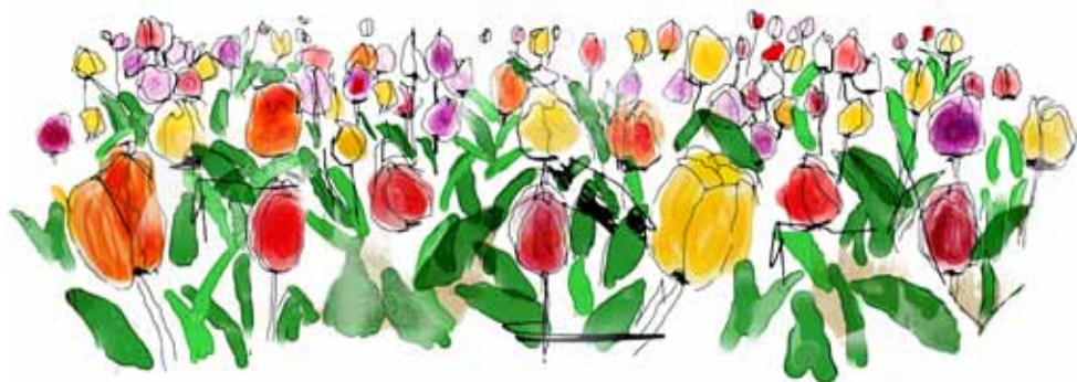
Illustration: Anna Ödlund

Bilderna ska vara ett komplement och stöd till vår profil. Bilderna ska spegla våra värderingar. Välj bilder som är mänskliga, naturliga och som inte är tillgjorda. Se också till att vi har fotografens eller tecknarens tillstånd att publicera bilderna/illustrationerna. Ange gärna fotografens eller illustratörens namn i anslutning till bilderna.