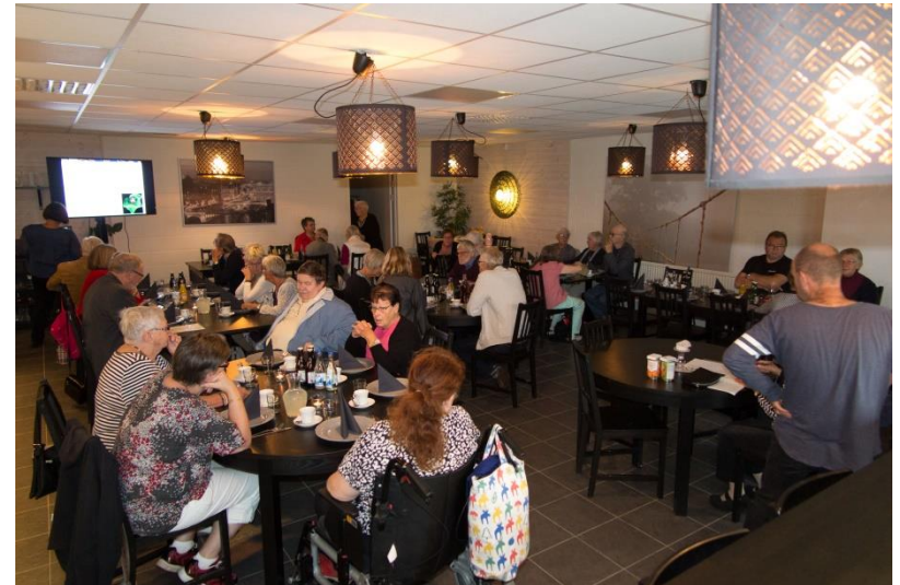
Deltagare och medlemmar